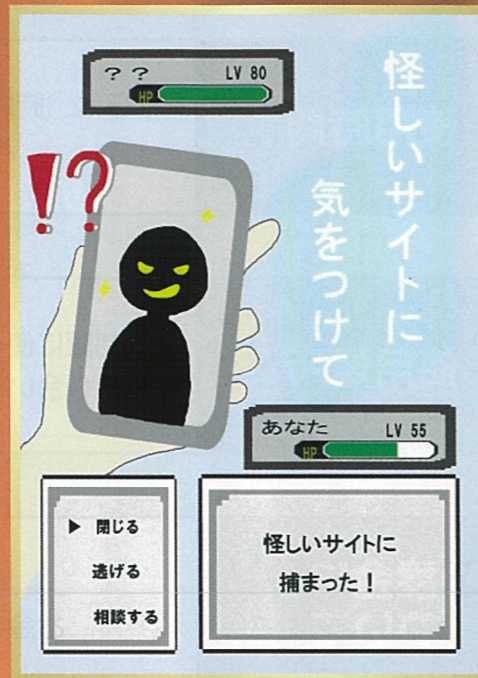
怪しいサイトに気をつけて