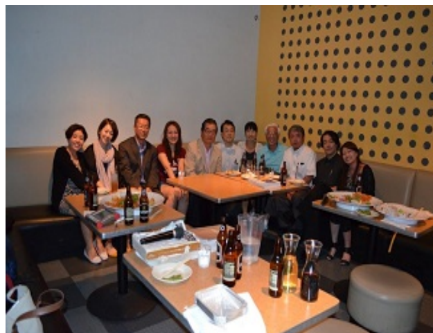
閉演後、RENTのキャストの方々と

1ヶ月のニューヨーク滞在中に素晴らしい出会いがたくさんありました。私の宿泊先はニューヨークにダンス留学に来ている人が多く、その大半は10代後半で高校卒業後すぐに単身で渡米し毎日朝から夜おそくまでレッスンに通っていました。同じ中部地区からダンス留学のために来ていた方の発表会に誘っていただき見に行くと、そこには世界中から若者が集まり素晴らしい舞台を作っていました。彼らと夢を語ったり、レッスンの話を聞くことは私にとってとても刺激になると同時に世界中にたくさんのダンサーがいて、日本はまだまだダンスを含めショービジネスが成長していかなくてはならないと痛感しました。身体が最良の状態であるときにニューヨークで活躍できるように、1日でも早く留学できるようにしようと決心しました。