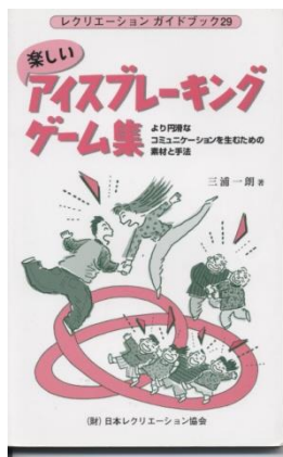
⑧アイスブレイキング集