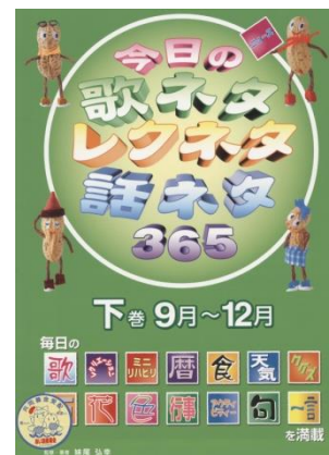
⑥今日の歌ネタレクネタ 話ネタ365 下巻