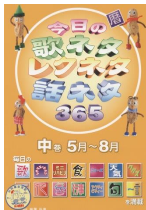
⑤今日の歌ネタレクネタ 話ネタ365 中巻