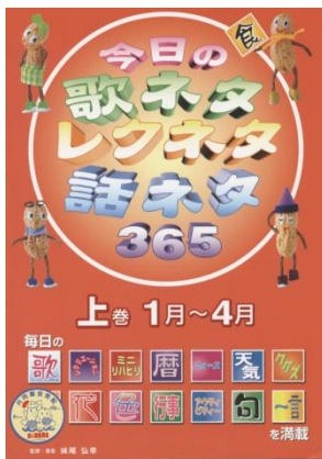
④今日の歌ネタレクネタ 話ネタ365 上巻